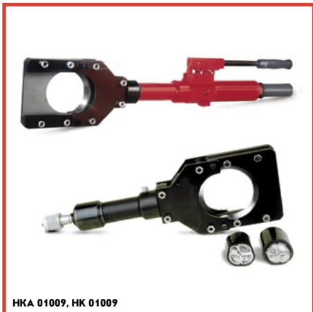
НКА 01009, НК 01009

Оптимальный выбор для резки кабеля с алюминиевыми и медными жилами, в том числе бронированного, и многожильных